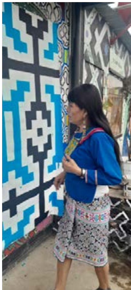
Ilustración 8 - Obra y autora en perspectiva (C)